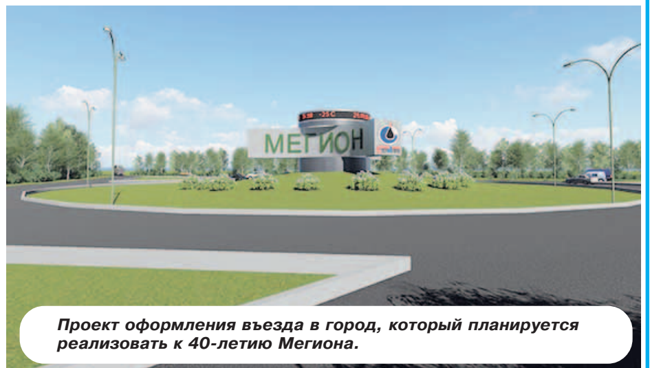
Проект оформления въезда в город, который планируется реализовать к 40-летию Мегиона.