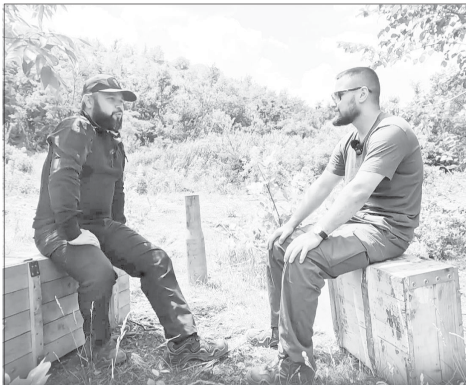
Его цель - добивать врага, добивать киевский режим, которым управляет настоящий преступник, нелюдь, убивающий собственный народ

Два месяца подготовки подразделения - и “Горыныча” с бойцами созданного танкового батальона с января 2023 года направили держать позиционную оборону на Сватово-Кременном направлении недалеко от Макеевки. Именно тогда “Горыныч” получил первые танки Т-90А, и летом все эти 11 танков пошли в наступление.