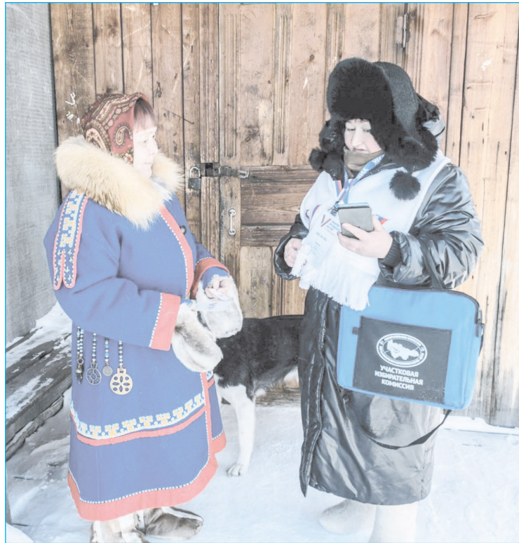
В досрочном голосовании примут участие те избиратели, которые находятся далеко от помещений для голосования, а транспортное сообщение с участковыми избирательными комиссиями отсутствует или затруднено

Одновременно в регионе работает федеральный проект "ИнформУИК", цель которого - адресно рассказать жителям, где и когда будут проходить выборы. Около трех тысяч членов участковых избирательных комиссий, заранее прошедших специальное обучение, проводят поквартирный обход. Они приходят к югор-