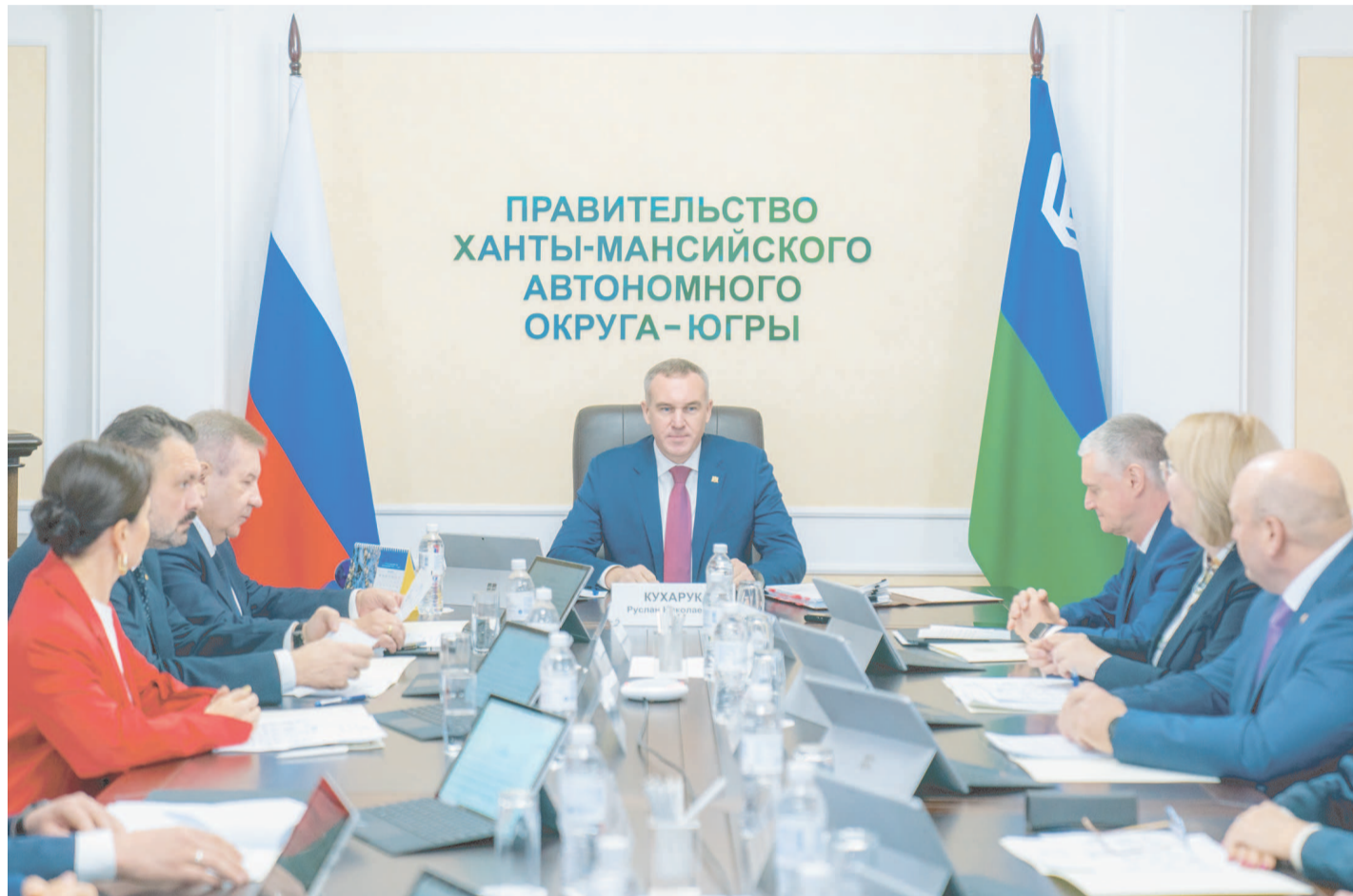
ПРАВИТЕЛЬСТВО ХАНТЫ-МАНСИЙСКОГО АВТОНОМНОГО ОКРУГА - ЮГРЫ