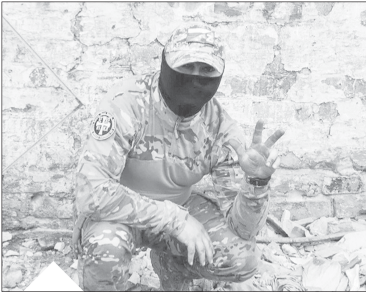
Мы, русские и сербы, - одна семья, братья по славянской крови