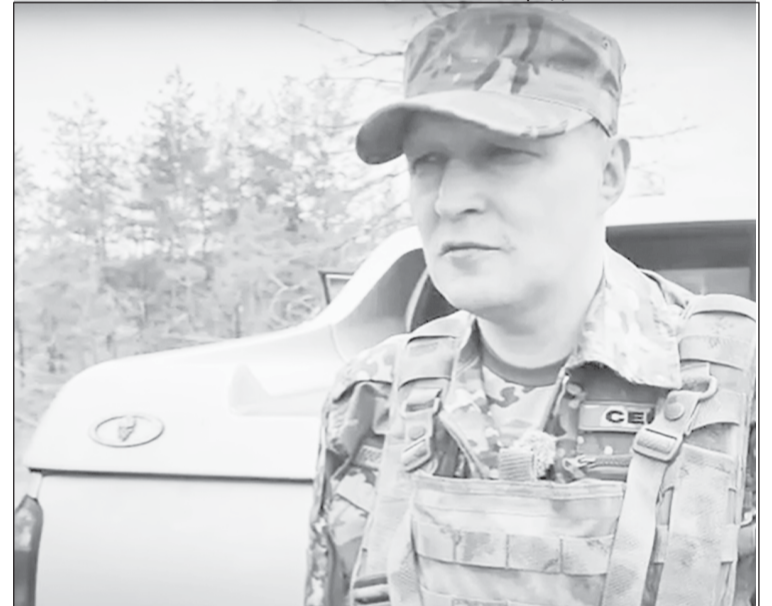
"Север" считает, что Югра находится на передовых позициях по поддержке своих военнослужащих, участвующих в СВО

Напомним, заявки от ребят отработываются в информационной системе АИС "Гумпомощь". Это платформа, на которой каждый боец может оставить заявку и каждый югорчанин может оказать посильную поддержку землякам на передовой.