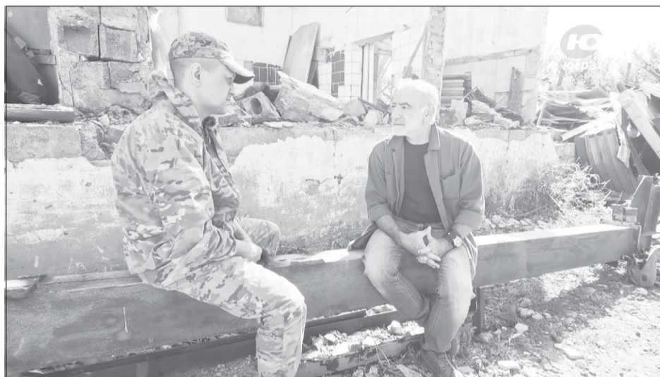
Сегодняшняя война - это когда крохотная "птичка" стоимостью в 50 тысяч рублей уничтожает танк, который стоит десятки миллионов

Как говорит Алексей, в зоне проведения спецоперации люди показывают себя с другой стороны, они более настоящие. На эту тему, по его