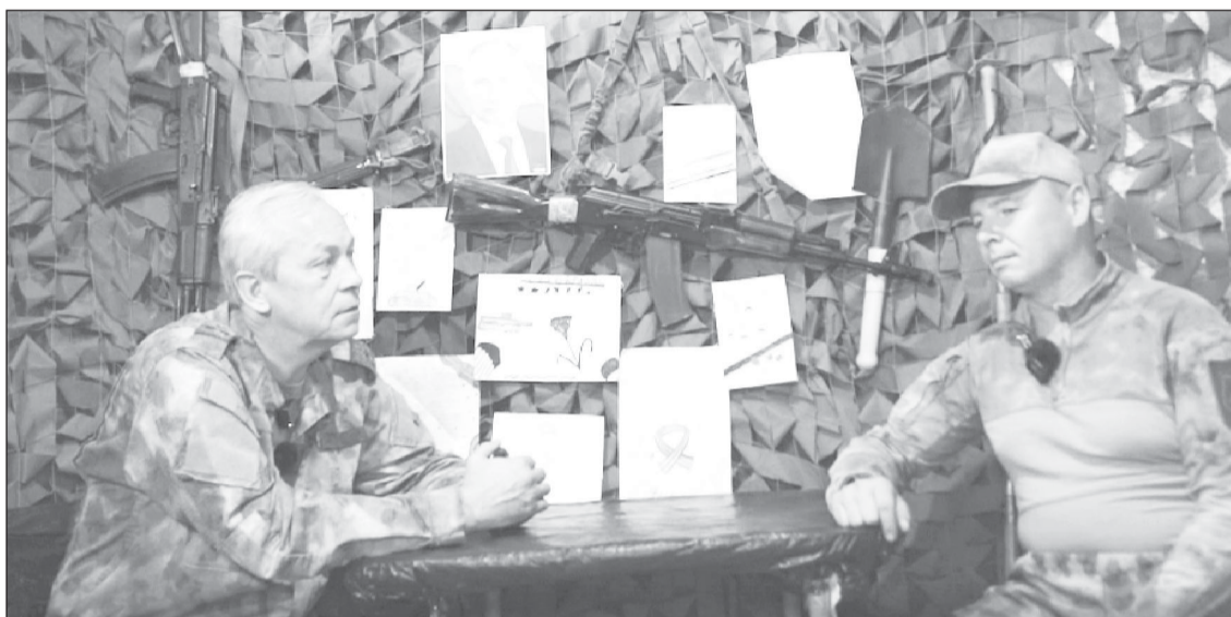
Саперы в Вооруженных Силах РФ - это те люди, от которых зависит и успех обороны, и успех наступления

- Приезжали инструкторы, очень многое показывали и рассказывали - о постановке мин, о