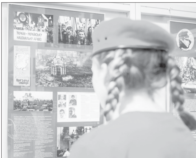
Выставка дополнена информацией о героях СВО