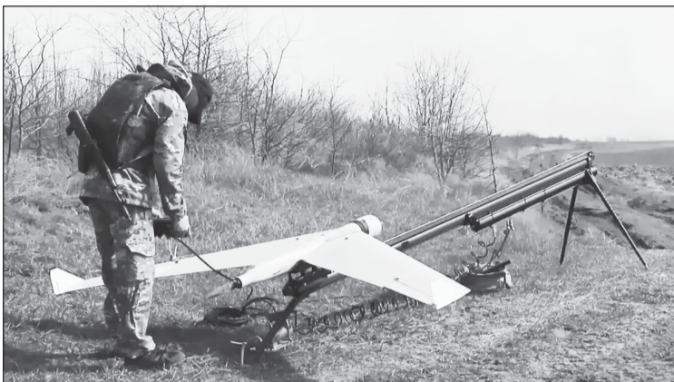
На сегодня это одно из самых безопасных направлений для прохождения службы по контракту

Один из тех, кто подписал контракт в регионе и ушел слу-