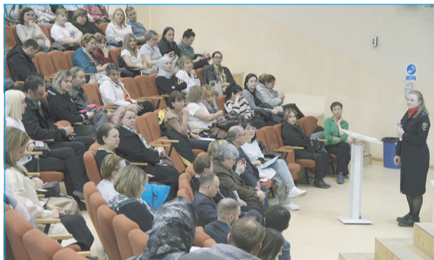
15 МАЯ в Мегионе на базе средней общеобразовательной школы №9 состоялось общегородское роди-

тельское собрание. Организатором мероприятия выступил департамент образования администрации города.