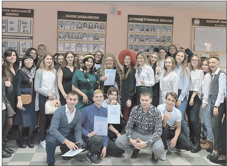
МО ВОД "Волонтеры Победы"

Результаты игры "РИСК: разум, интуиция, скорость, команда": первое место - школа №2; второе - Дворец искусств; третье место - городская стоматологическая поликлиника.