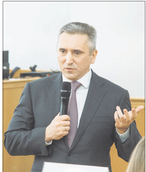
Оплата публикации произведена за счет средств избирательного фонда кандидата на должность губернатора Тюменской области Александра Викторовича Моора.

Продумывая дальнейшее развитие вузов, мы решили обустроить весь студенческий комплекс по принципу кампуса. В его условных границах будут находиться учебные корпуса, студенческие общежития, библиотеки, спортивные объекты и зоны отдыха.