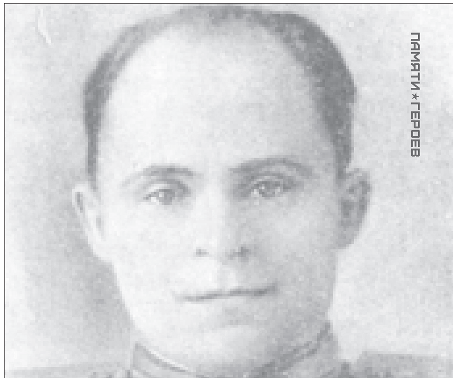
ПАМЯТИ * ГЕРОЕВ

В небо взвилась красная ракета, возвещая о захвате плацдарма за Дунаем. На горстку храбрецов немцы обрушили яростные контратаки. Когда иссякли боеприпасы, раз-