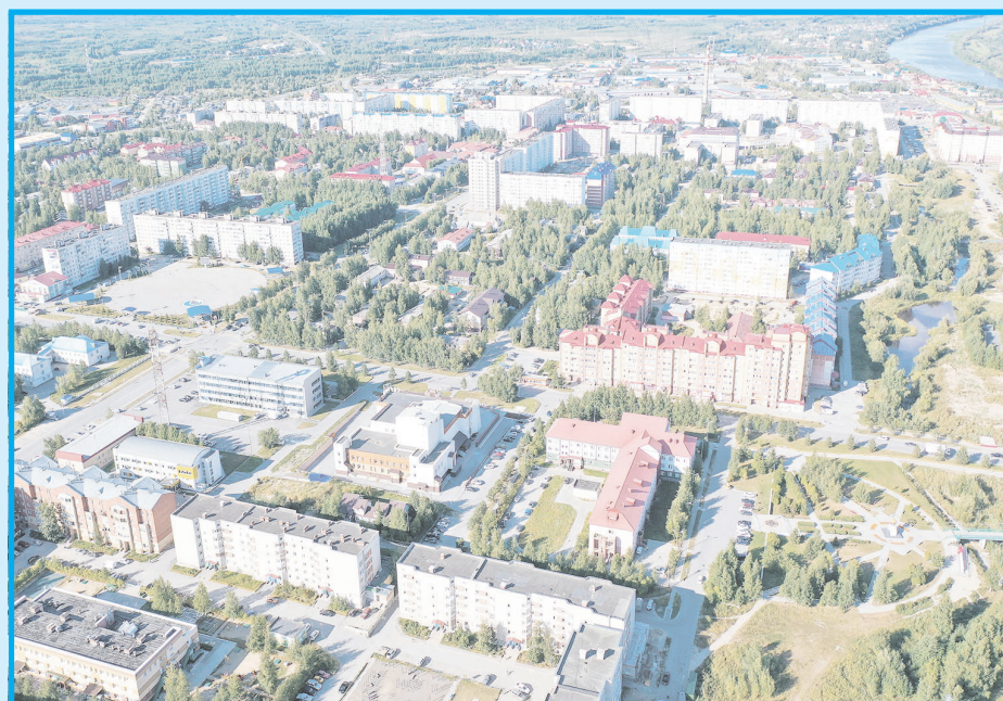
Панорама Мегиона с высоты птичьего полета, 2020 год. Урбанизация мегионского пейзажа.