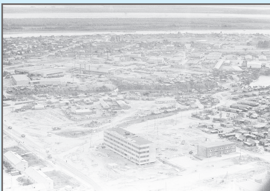
Панорама Мегиона с высоты птичьего полета, 1984 год. На переднем плане - здание ПО "Мегионнефть" (сейчас здесь располагается ЛДЦ "Здоровье").