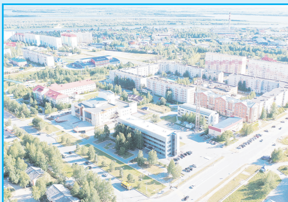
Панорама Мегиона с высоты птичьего полета, 2020 год. На переднем плане ЛДЦ "Здоровье". Современная городская застройка.