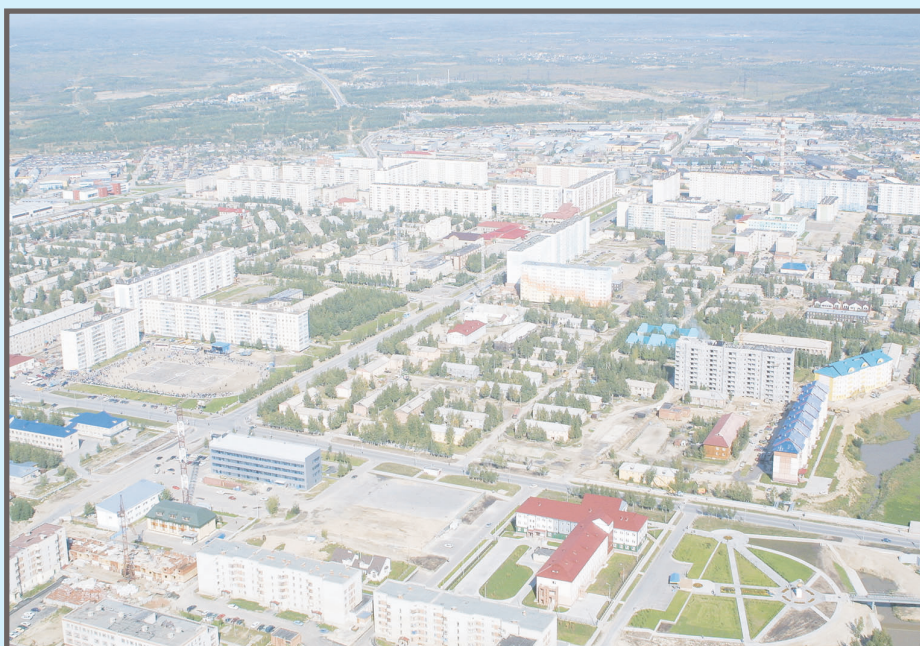
Панорама Мегиона с высоты птичьего полета, 2001 год. Уже заложен сквер 500-миллионной тонны нефти, строится дом 1 по Театральному проезду (сдан в 2002 году).