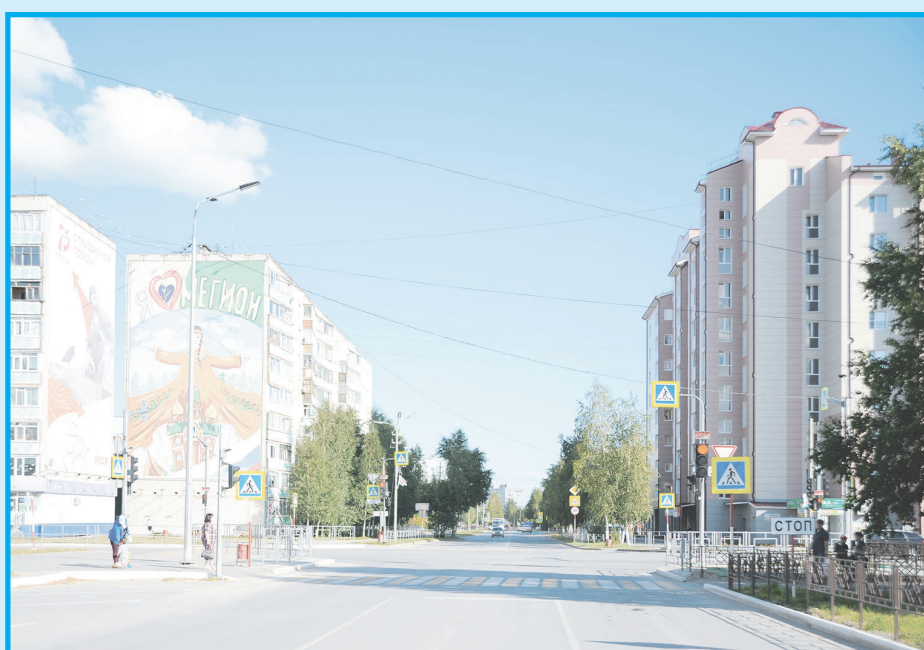
Перспектива улицы Свободы от перекрестка с ул. Нефтяников, 2020 год. Из-за выросших деревьев и обширной городской застройки дом 14 по улице Ленина (на заднем плане) уже не производит былого впечатления.