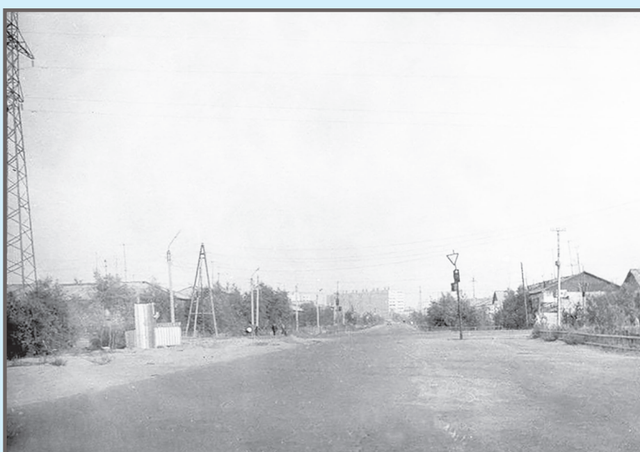
Перспектива улицы Свободы от перекрестка с ул. Нефтяников, 1985 год. На заднем плане - первое городское 9-этажное здание - дом 14 по улице Ленина.