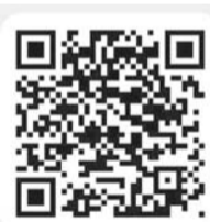
Жилищный надзор Югры

Приглашаем всех мегионцев присоединиться к опросу и поделиться своим мнением о работе управляющих организаций. Ваше мнение поможет сделать жилищно-коммунальное хозяйство региона ещё более эффективным и клиентоориентированным.