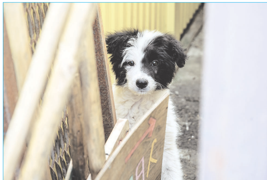
Отпускать стерилизованную и вакцинированную собаку на улицу в мороз негуманно. Единороссы предлагают исключить из цепочки понятие "выпуск".

- Бродячих животных, которые попадают в приюты, обязательно регистрируют в автоматизированной информационной системе, их чипируют, вакцинируют и стерилизуют. С питомцами, у которых есть хозяева, ситуация немного иная: регистрация для них тоже существует, но она носит добровольный характер, - рассказала исполняющая обязанности руководителя ветеринарной службы автономного округа Дина Кузьмина.