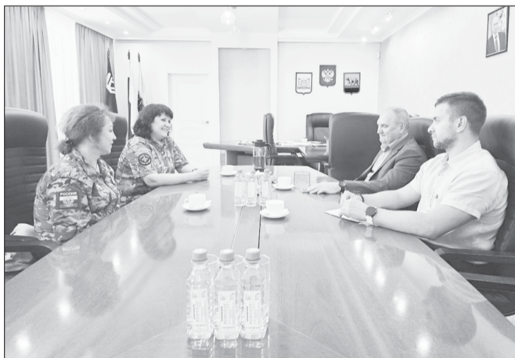
Жительницы Нефтеюганска служат в медицинской ротепочти два года

Напомним, Ханты-Мансийский автономный округ, кроме финансовой, осуществляет также и материально-техническую поддержку своих контрактников. По запросу командира части, в которой служат югорчане, приобретается и передается к месту несения службы специализированное оборудование, необходимое военнослужащим. За неделю в правительство региона приходит до 40 заявок от бойцов, за месяц - более 200.