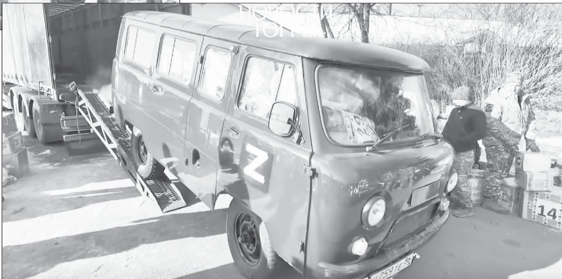
Помощь от неравнодушных жителей Ханты-Мансийска - от посылок до машин

- Хочется выразить огромную благодарность именно за помощь. То есть, мы находимся почти за 4 тысячи километров, а по ощущениям - будто дома, - говорит боец с позывным "Орел".