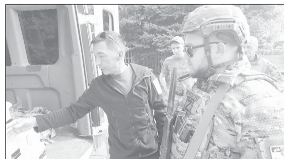
Югра доставляет спецсредства по всей линии фронта

- Да все нормально у нас. Не в санатории же, поэтому все хорошо. Много здесь наших, югорчан. У нас тут братство, все на связи и выполняют свои задачи достойно.