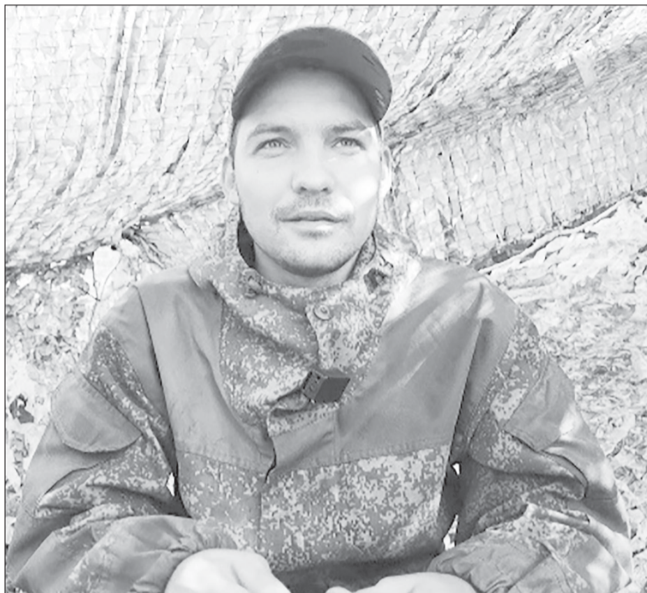
Планы у “Казака” на “после победы” грандиозные

- А сейчас наша очередь. Первое время, говорит сургутянин, было не