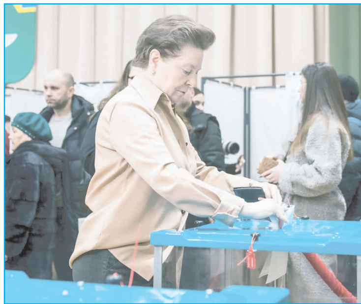
По традиции глава региона проголосовала в первые часы на участке № 294 в Ханты-Мансийске

Сегодня Югра собирает не только деньги, но и продукты, стройматериалы, инструменты - все то, что может понадобиться нашим защитникам Отечества в зоне СВО. Голос и мнение каждо-