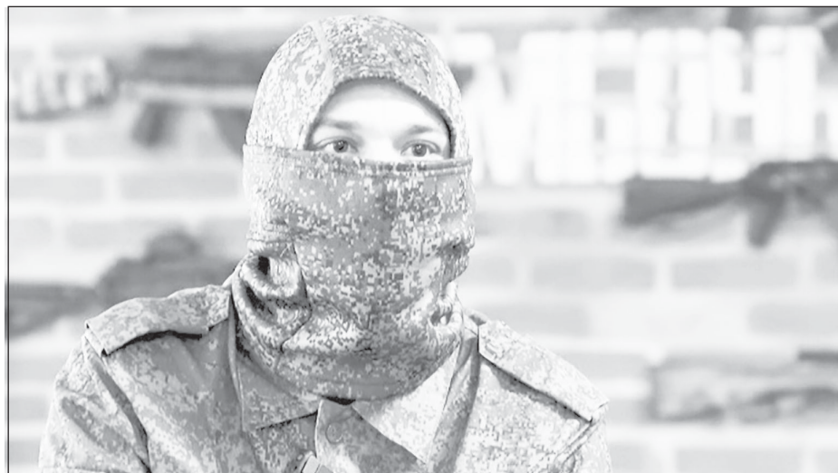
"Гусь" был готов к тому, что когда-нибудь придется защищать Родину

- ДОЛГО не думал. Поехал на фронт помогать пацанам, - рассказывает боец.