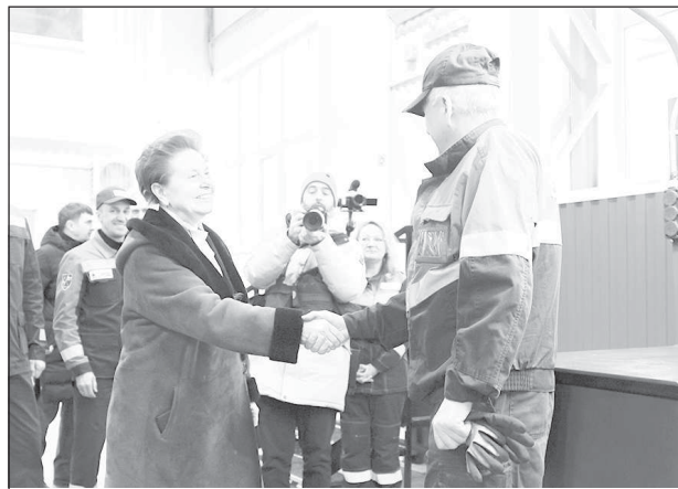
Социальные проекты "Мегионнефтегаз" реализует в тесном партнерстве с региональными властями

Добавим, что нынешний год для "Мегионнефтегаза" особенный: 1 августа предприятию исполнится 60 лет.