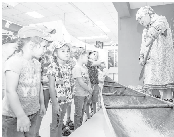
При поддержке нефтяников в краеведческом музее Мегиона открыли уникальную этнографическую выставку