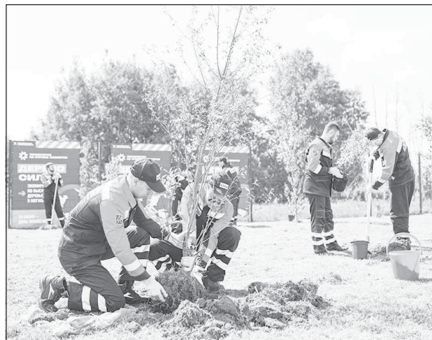
За последние три года волонтеры "Мегионнефтегаза" высадили в городе более 1,5 тыс. деревьев и кустарников

Уже в ближайшее время стартуют мероприятия, посвященные этой знаменательной дате. И можно не сомневаться, что юбиляры преподнесут родному городу и его жителям немало приятных сюрпризов.