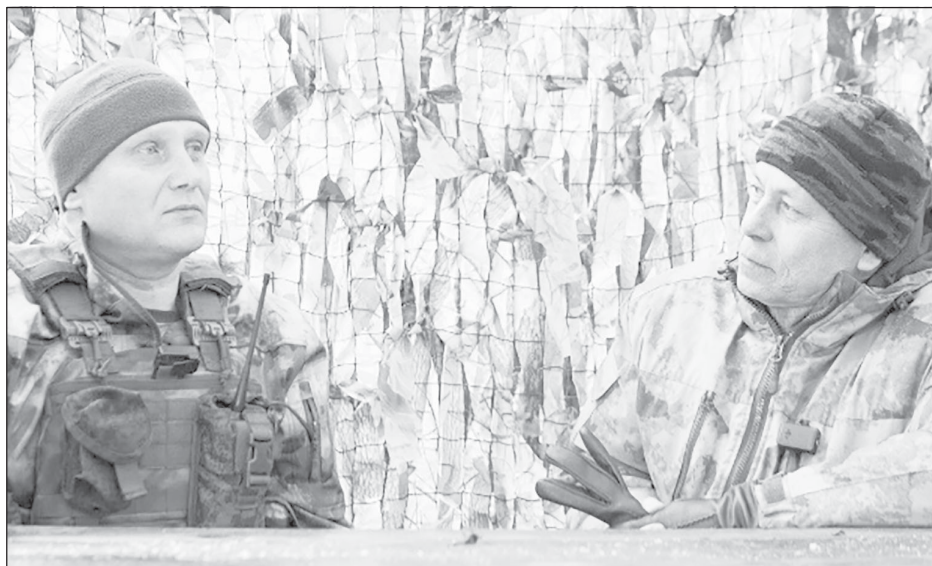
"Эти два слова - "Я русский" - вызывают удивительное ощущение сопричастности к нашей огромной стране. Это непередаваемое состояние"