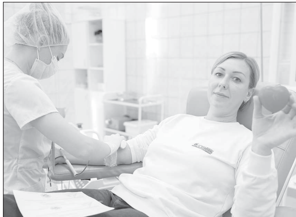
Донорское движение "Мегионнефтегаза" вошло в число лучших социальных практик региона

"Многогранное и многолетнее сотрудничество му-