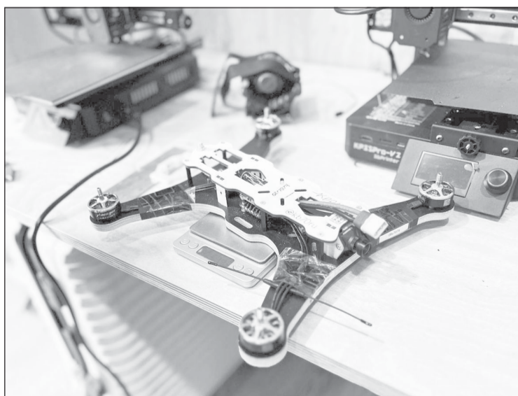
Стоимость дронов от "Сармата" ниже импортных в 3-4 раза

Отметим, "Сармат" обучает всех желающих управлению беспилот-