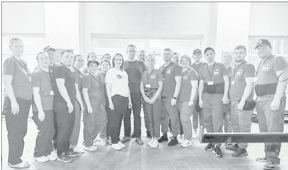
Врио губернатора Югры подчеркнул важность и масштаб гуманитарной миссии

- Здесь добровольцами работают медики, соцработники, преподаватели, педагоги, государственные и муниципальные служащие - люди разных профессий,