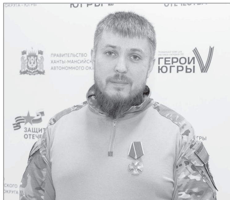
Наш герой - очень многосторонний. Свое желание быть полезным Родине он реализует в программе по подготовке управленческих кадров "Герои Югры"