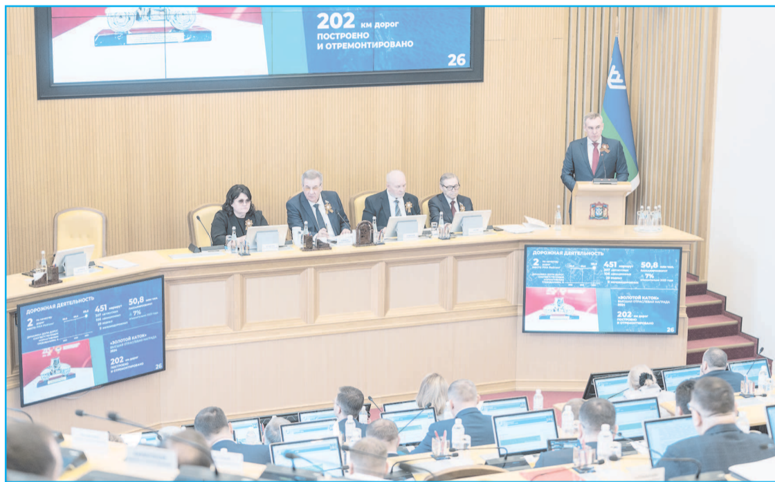
Губернатор Югры выступил с первым отчетом о работе правительства перед депутатами

С 2022 года Россия живет в условиях "адских" санкций и ограничений со стороны государств Запада, которые сделали все, чтобы нанести страте-