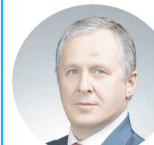
Алексей САВИНЦЕВ, руководитель фракции КПРФ в Думе Югры:

" - Надо отдать должное тому, что бюджет округа продолжает расти, и большая его часть направляется, прежде всего, на улучшение качества жизни югорчан. Это ключевые темы, которые губернатор озвучил в своем отчете. Они находят свое отражение в обратной связи от жителей.