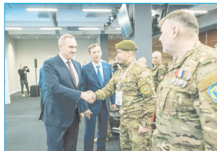
В Югре дополнительно к федеральным решениям утвержден и реализуется обширный комплекс региональных мер поддержки участников СВО

Участники специальной военной операции, их семьи также нуждаются в нашем участии и помощи. Поэтому в Югре, как сообщил губернатор, дополнительно к федеральным решениям утвержден и реализуется обширный комплекс региональных мер. Более 24 тысяч бойцов и чле-