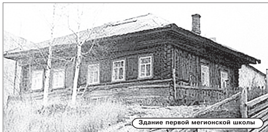
Здание первой мегионской школы