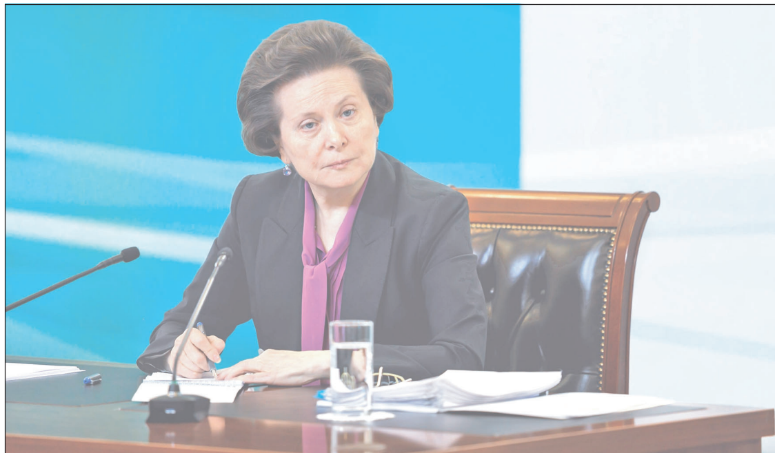
Губернатор Югры Наталья Комарова подписала распоряжение, которым утвердила план работы Правительства округа по реализации Послания Президента Российской Федерации Федеральному Собранию Российской Федерации, с которым Президент России Владимир Путин выступил 15 января 2020 года.

"И, наконец, как мы и договаривались, с этого года начнет поэтапно внедряться новая система оплаты труда в здравоохранении, основанная на прозрачных, справедливых и понятных правилах, с установ-