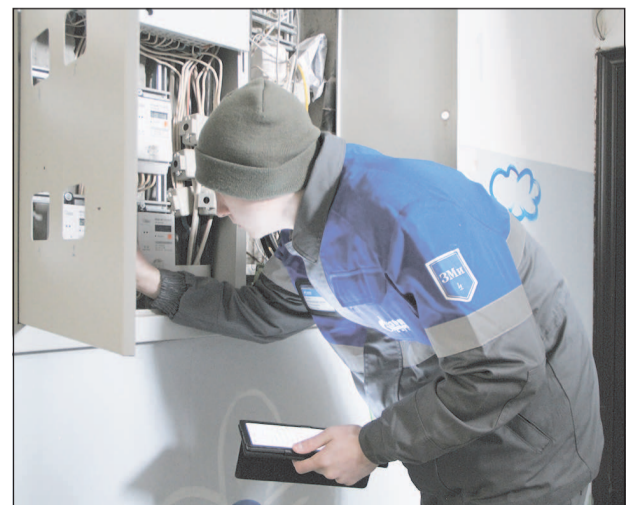
График проведения контрольного снятия показаний приборов учёта в 2023 году собственники жилых помещений могут посмотреть на сайте gesbt.ru , в разделе "Частным лицам - Энергосбережение - Графики снятия показаний".

Во время контрольных снятий показаний специалист использовал электронный планшет с централизованной базой по единой форме и сразу вносил сведения. Такой подход снижает риск искажения информации в процессе передачи данных. Контроль показаний постепенно становится технологичным процессом благодаря приборам нового поколения. Весь учёт электропотребления проходит оперативно и практически безошибочно.